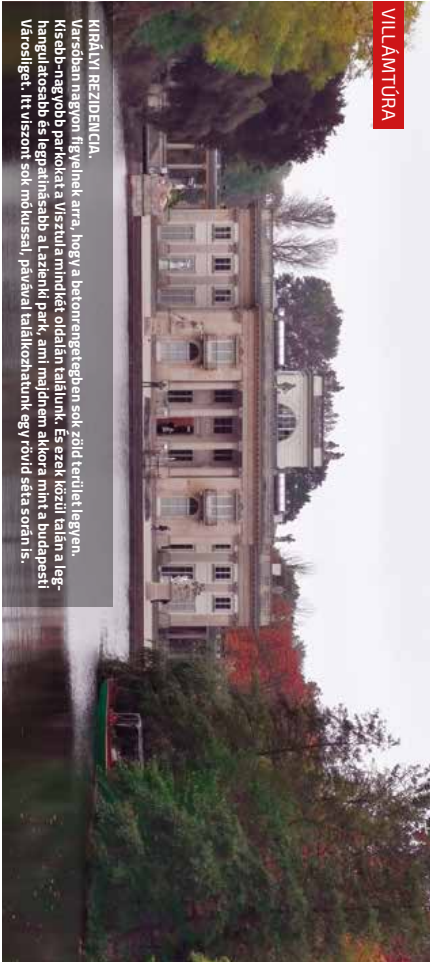
KIRÁLYI REZIDENCIA. Varsóban nagyon figyelnek arra, hogy a betonengeregben sok zöld terület legyen. Kiseb-nagyobb parkokat a Visztula mindkét oldalán találunk. Ez ezek közül talán a legnagyobb és legpatinásabb a Lenin park, ami ma minden akkora mint a budapesti Városliget. Itt viszont sok műkussal, pávákkal találkozhatunk egy rövid séta során is.