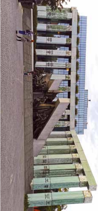
RÉGI-MODERN. Az igazságügyi Palota régi-modern épülete. Előtte a városi felkelésre emlékeztető szoborcsoport kapott helyet.