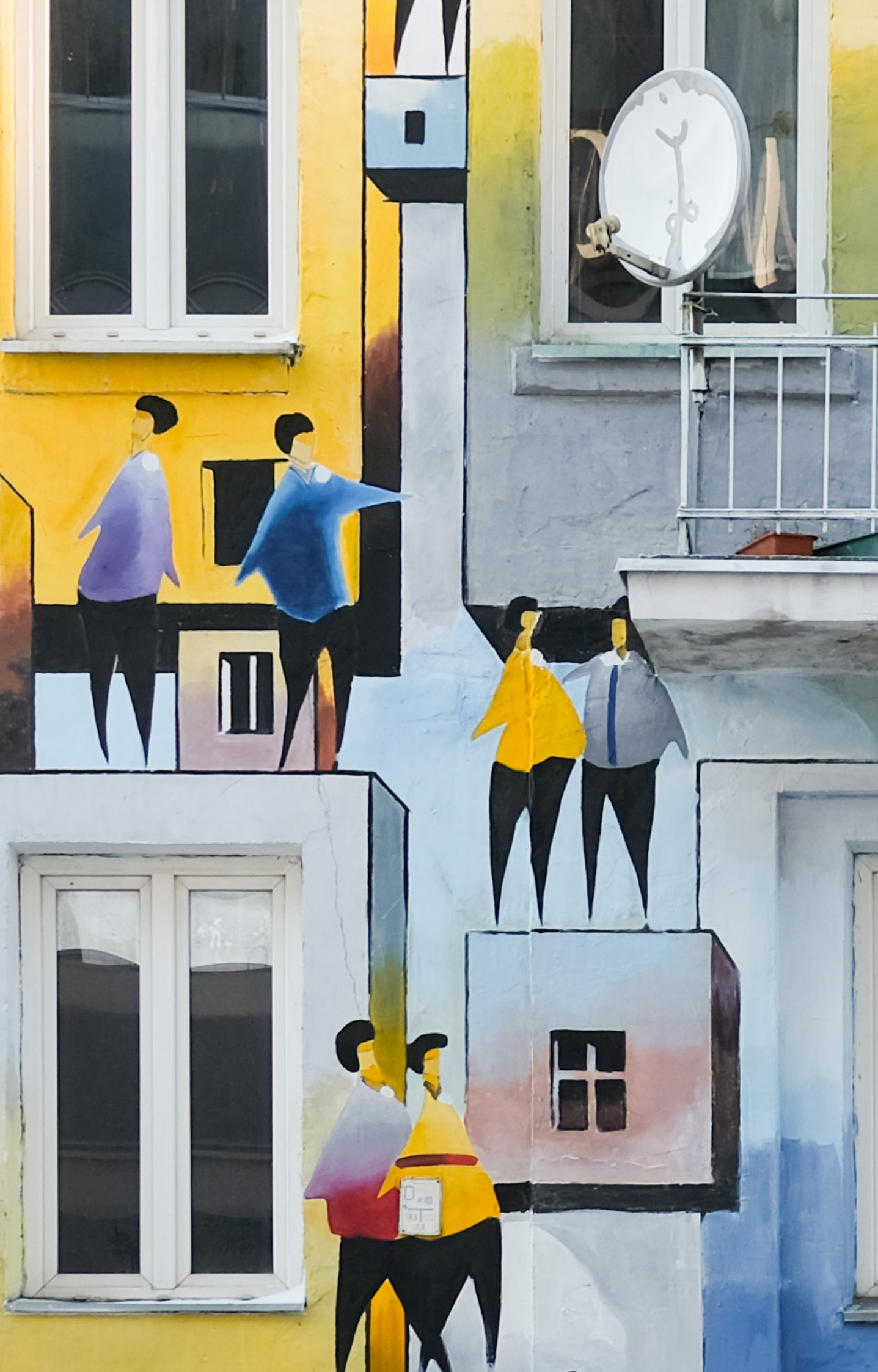
Szlakiem warszawskich murali Tytusa Brzozowskiego